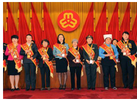
纪念“三八”国际妇女节暨全国三八红旗手(集体)表彰大会举行