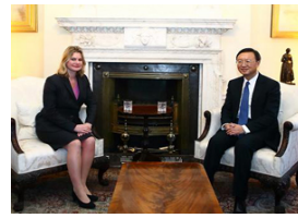
杨洁篪会见英国国际开发大臣