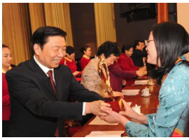
李源潮出席纪念“三八”国际妇女节暨全国三八红旗手表彰大会并讲话